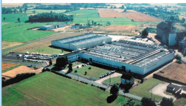
Завод в г. Шартр, Франция:

Завод в городе Шартр является одним из самых современных заводов в Европе по производству стальных панельных радиаторов, основан в 1965 году, имеет крытые производственные площади 63000 м 2 . Завод производит около 800000 стальных панельных радиаторов в год под торговой маркой СНАРПЕЕ. На заводе работает 140 человек.