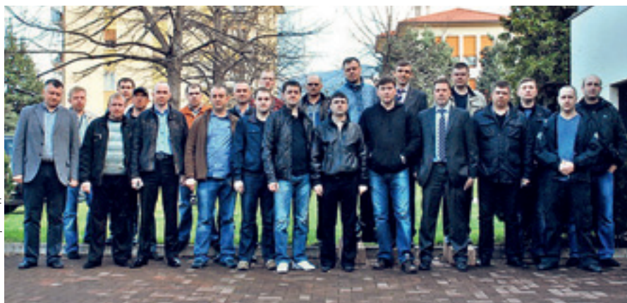
●● Победители программы «BAXI-Клуб» за 2010 год посетили завод BAXI S.p.A. в Италии

Для того чтобы стать участником программы «BAXI-Клуб» необходимо: